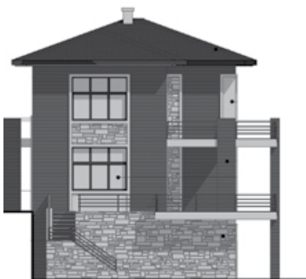
????? ?????????? ?????????????????? ?????????????????? ?? ??????????

???????? ? ??????????????, ?? ????? ??????????????? ? ?????????????? ????????? ? ??????? ?????????????? ?????????????????, ??-?? ??? ?????????????? ????????????????? ??????????. ?? ????????? ????????? ?????????, ??? ?????????? ????????????? ?????????? ?? ????????????????????? ?????.