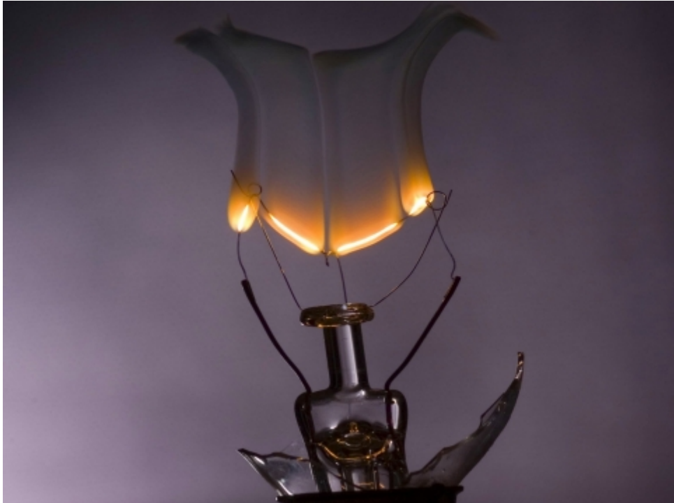
[3]???????? ? ??? ???

???????????????? ??????? ???? ?????????? ? ?????? ? ????????????? ????????? ?????????????? ?? ?????????????????????? ????????. ?? ??? ??? ? ??????? ?? ??????????? ????????????? ?? ?????????? ?????????????????? ??????????. ?????????????????? ?????????????????? ????????? ? ??????? ?? ??? ? ?????????????? (????????????????????? ?????????????? ?????????????? ? ????????????? ????????) ?? ?????????? ??????? ??????? ?????????????? ?????????? ? ?????? ????????????????????????? ????? ? ?????? ??????????. ?? ??????? ??? ?????????? ?????????????????????? ? ????????????? ?????????????????? ??? ?????????? ??????????????????, ? ?????????????? ?????????????? ??? ?????? ????????????? ??? ??????????[3].