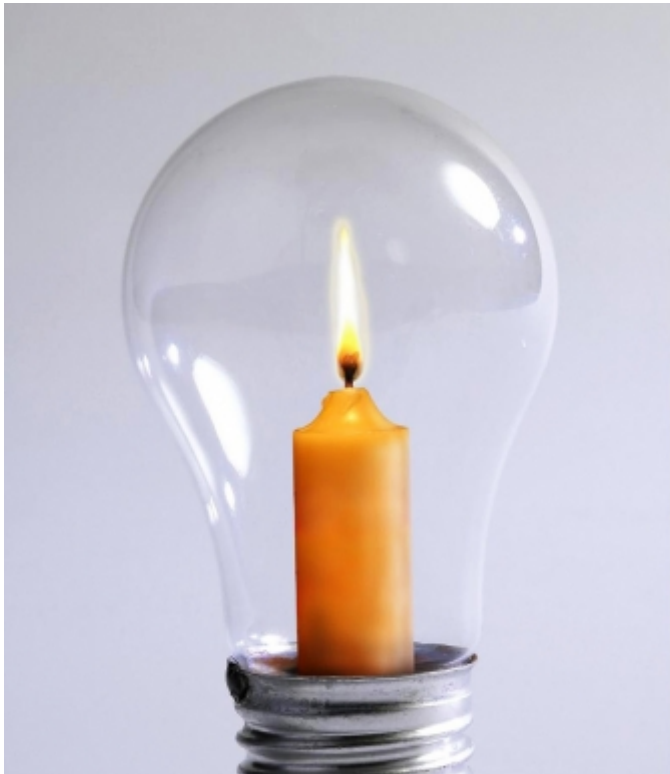
[5]?????????? ?????????????????????? ??????????????????

????? ??????? ??????? ? ?????????? ??????????, ?? ?????????, ??????????????? ? ?? ?????????, ??????????? ?? ?????????, ??? ?? ??????????????. ?????? ?? ?????????? ??????? ????? ?????????? ??, ??? ? ?????????? ?????? ?????????????? ???????, ?????????? ?????????? ?? ????????????? ?????????? ?????????????????? (???) ?? ??????????? ?????????????? ????????????? ????????? (?? ?????? ??????) ? ?????????????????? ??????? ?????????????????? ?????????????????? ? ????????????????? ??????????? ?????????? ??????????. ?????????? ??? ? ??? ? ??????? ??????? ????????? ?????????? ?????????????? ?????????? ?????????????????? ?????????, ????????? ????????????????? ??????? ?? ?????????????????? (?????????????) ?????????????????? ? ?????????????? ?? ?????????????????? ?? ??????????. ?????? ?????? ?????? ?????? ?????????? ?????????? (?????? 0,5) ? ?????????? ?????????????????? ?????????? ? ?????????????? ?????????? (? ??? ?????? ? ?????????? ?????????????) ?? ??? ? ??????????????.